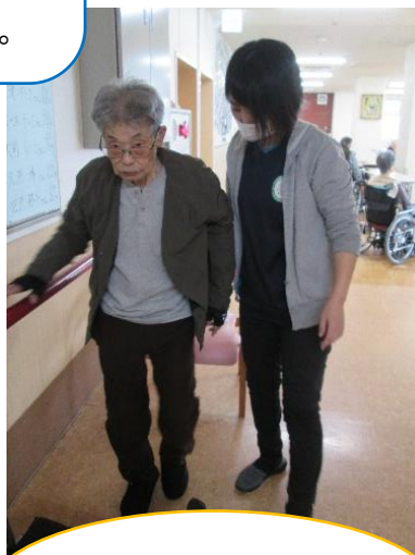
表情豊かな鬼の飾りが出来ました。