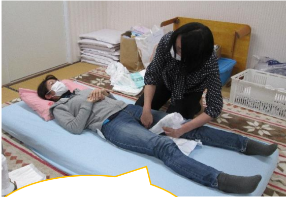
太もものお肉や皮 を外に出すのがポ イントです♪